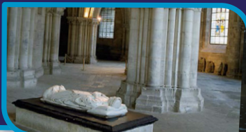
Cathédrale de Bourges - gare de Bourges