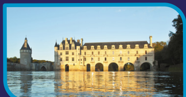
Château de Chenonceau - gare de Chenonceaux

Véloroute "Cœur de France à Vélo" en cours de réalisation, non ouverte au public "Cœur de France" cycling route construction in progress, not yet open to the public