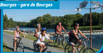
Canal de Berry

Retrouvez tous les itinéraires cyclotouristiques sur itivelo.encentrevalde Loire.com et francevelotourisme.com/destinations/region-centre-val-de-loire-a-velo